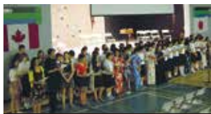
カナダ海外研修旅行 (高1) 希望者対象でホームステイし、フェアウェルパーティでは研修成果を英語で発表。