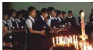
校内研修 (中1) 「聖園生になるための心の勉強」。キャンドルサービスでの一人ひとりの祈り。