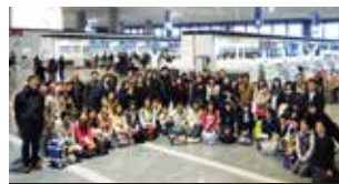
ニュージーランド中期留学 (中3) 希望者対象の2ヶ月半の中期留学です。家族・先生に見守られて出発。