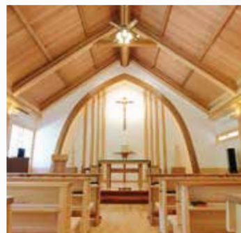
いつでも だれにでも 心静かに祈る場として。