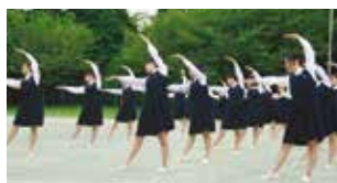
ファウスト (高3) 涙とともに舞う、1回生から受け継がれてきた伝統のダンス。