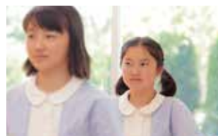
学内のどこからも見える美しい自然を背に学習に集中。